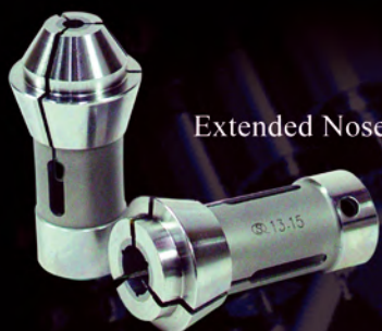
Extended Nose Collets