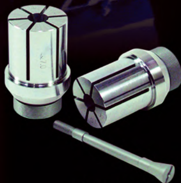
Internal Diameter Clamping Collets